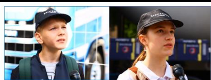
Repülést követő aktivitások