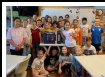
Repülést megelőző képzés

85 iskola, több mint 5300, 10-12 éves tanulója érintett az ingyenes, élményalapú, speciális STE(A)M oktatási programunkban. Több mint 170 tanárt készítettünk fel és osztottuk meg velük a tanításhoz szükséges tananyagot (tanulói munkafüzet, tanári kézikönyv, STE(A)M útmutató).